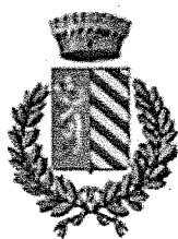
Comune Lugignano Val d'Arda